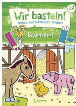
Wir basteln! - Malen, Ausschneiden, Kleben - Bauernhof