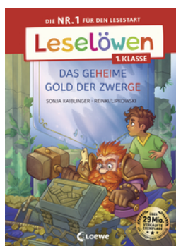
Leselöwen 1. Klasse - Das geheime Gold der Zwerge (Großbuchstabenausgabe)