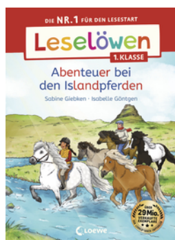
Leselöwen 1. Klasse - Abenteuer bei den Islandpferden