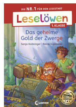
Leselöwen 1. Klasse - Das geheime Gold der Zwerge