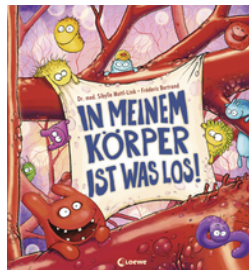
In meinem Körper ist was los!