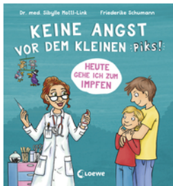
Keine Angst vor dem kleinen Piks!