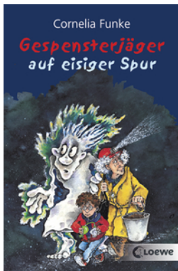
Gespensterjäger auf eisiger Spur