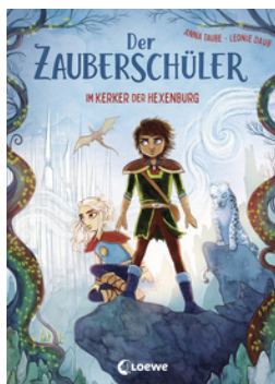
Der Zauberschüler (Band 5) - Im Kerker der Hexenburg