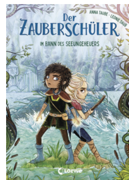
Der Zauberschüler (Band 2) - Im Bann des Seeungeheuers