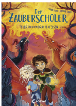
Der Zauberschüler (Band 6) - Feuer über dem Drachenfels