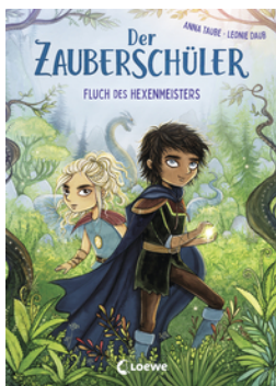
Der Zauberschüler (Band 1) - Fluch des Hexenmeisters