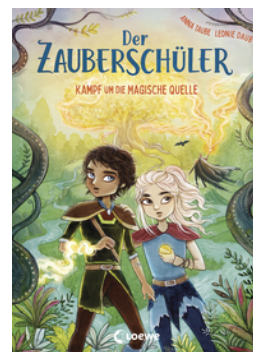
Der Zauberschüler (Band 4) - Kampf um die Magische Quelle