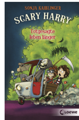
Scary Harry (Band 2) - Totgesagte leben länger