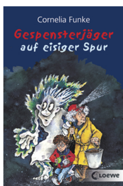
Gespensterjäger auf eisiger Spur