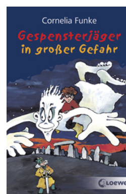
Gespensterjäger in großer Gefahr