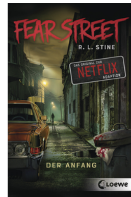
Fear Street - Der Anfang