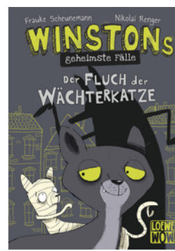
Winstons geheimste Falle (Band 1) - Der Fluch der Wacherkatze