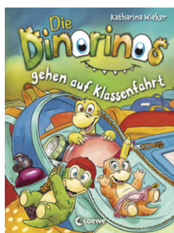
Die Dinorinos gehen auf Klassenfahrt (Band 5)