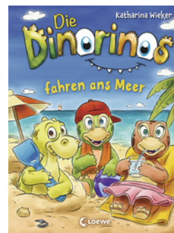
Die Dinorinos fahren ans Meer (Band 4)