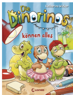
Die Dinorinos können alles (Band 1)