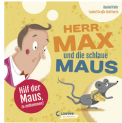
Herr Max und die schlaue Maus