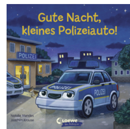
Gute Nacht, kleines Polizeiauto!