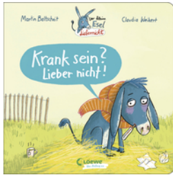
Der kleine Esel Liebernickt - Krank sein? Lieber nicht!