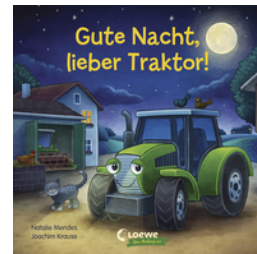
Gute Nacht, lieber Traktor!