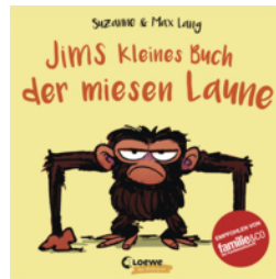
Jims kleines Buch der miesen Laune