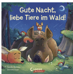
Gute Nacht, liebe Tiere im Wald!