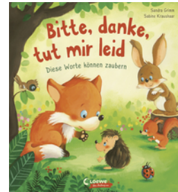
Bitte, danke, tut mir leid