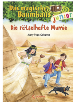
Das magische Baumhaus junior (Band 3) - Die rätselhafte Mumie