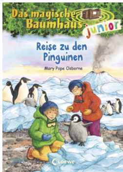
Das magische Baumhaus junior (Band 37) - Reise zu den Pinguinen