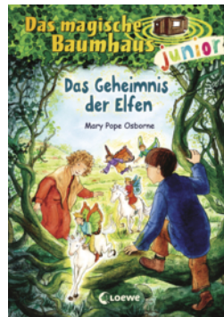
Das magische Baumhaus junior (Band 38) - Das Geheimnis der Elfen