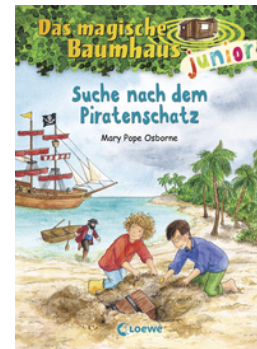
Das magische Baumhaus junior (Band 4) - Suche nach dem Piratenschatz