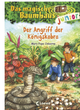
Das magische Baumhaus junior (Band 39) - Der Angriff der Königskobra