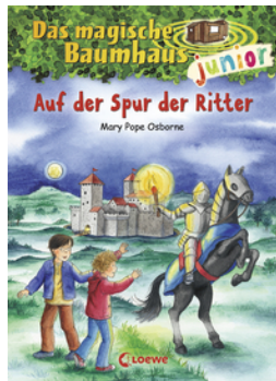
Das magische Baumhaus junior (Band 2) - Auf der Spur der Ritter