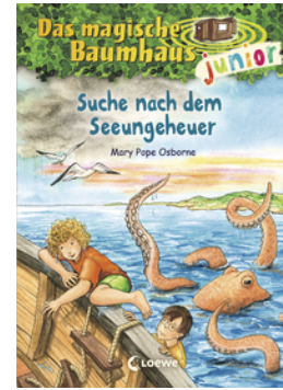
Das magische Baumhaus junior (Band 36) - Suche nach dem Seeungeheuer