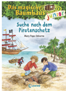
Das magische Baumhaus junior (Band 4) - Suche nach dem Piratenschatz