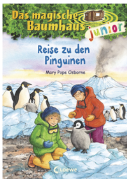
Das magische Baumhaus junior (Band 37) - Reise zu den Pinguinen