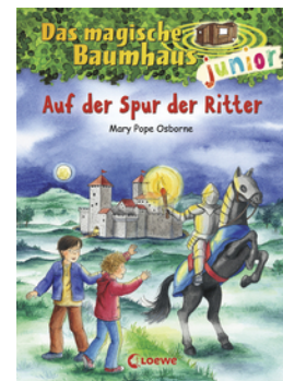
Das magische Baumhaus junior (Band 2) - Auf der Spur der Ritter