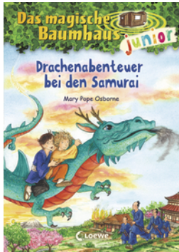
Das magische Baumhaus junior (Band 34) - Drachenabenteuer bei den Samurai