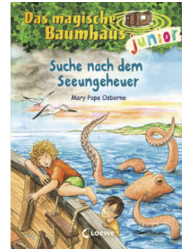
Das magische Baumhaus junior (Band 36) - Suche nach dem Seeungeheuer