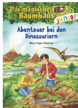
Das magische Baumhaus junior (Band 1) - Abenteuer bei den Dinosauriern