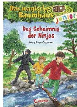
Das magische Baumhaus junior (Band 5) - Das Geheimnis der Ninjas