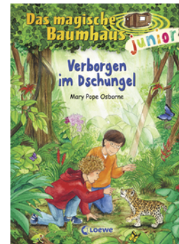
Das magische Baumhaus junior (Band 6) - Verborgen im Dschungel