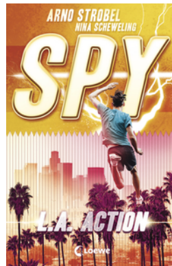
SPY (Band 4) - L.A. Action