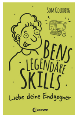
Bens legendäre Skills (Band 1) - Liebe deine Endgegner