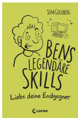
Bens legendäre Skills (Band 1) - Liebe deine Endgegner