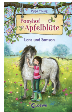
Ponyhof Apfelblüte (Band 1) - Lena und Samson