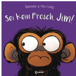
Sei kein Frosch, Jim!