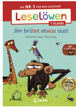
Leselöwen 1. Klasse - Jim ist mies drauf - Jim brütet etwas aus!