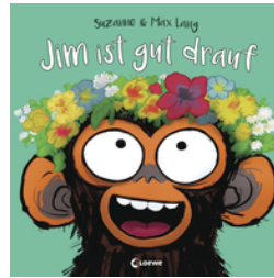
Jim ist gut drauf