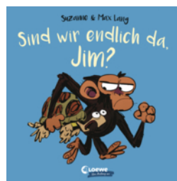
Sind wir endlich da, Jim?