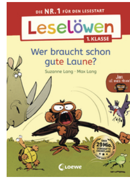
Leselöwen 1. Klasse - Jim ist mies drauf - Wer braucht schon gute Laune?