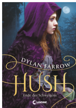
Hush (Band 2) - Ende des Schweigens