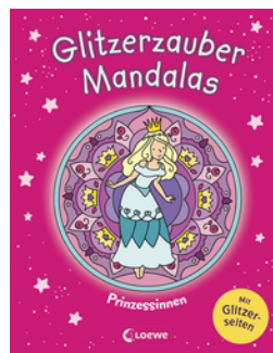
Glitzerzauber-Mandalas - Prinzessinnen