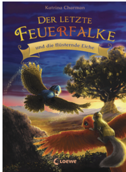
Der letzte Feuerfalte und die flüsternde Eiche (Band 3)