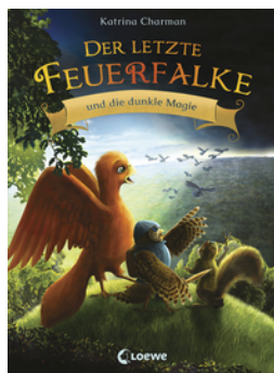
Der letzte Feuerfalke und die dunkle Magie (Band 6)