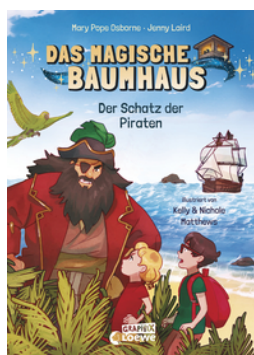
Das magische Baumhaus (Comic-Buchreihe, Band 4) - Der Schatz der Piraten