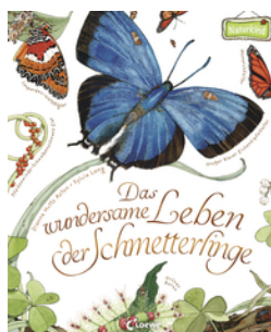
Das wundersame Leben der Schmetterlinge