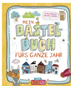
Mein Bastelbuch fürs ganze Jahr