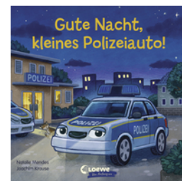
Gute Nacht, kleines Polizeiauto!