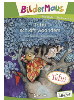
Bildermaus - Tafiti schläft woanders