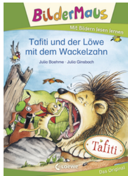
Bildermaus - Tafiti und der Löwe mit dem Wackelzahn