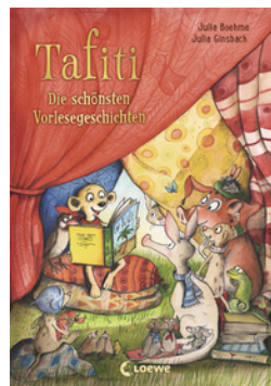
Tafiti - Die schönsten Vorlesegeschichten