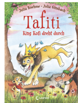
Tafiti - King Kofi dreht durch (Band 21)