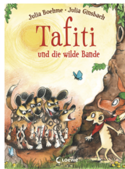
Tafiti und die wilde Bande (Band 20)