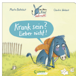
Der kleine Esel Liebernicht - Krank sein? Lieber nicht!