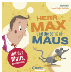
Herr Max und die schlaue Maus