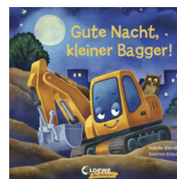
Gute Nacht, kleiner Bagger!