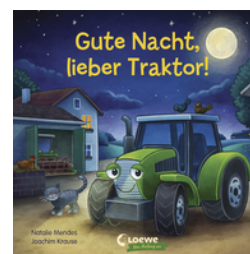
Gute Nacht, lieber Traktor!