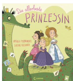
Die allerbeste Prinzessin