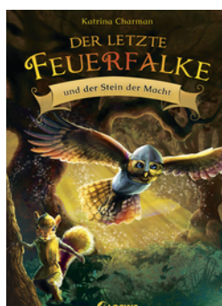
Der letzte Feuerfalke und der Stein der Macht (Band 1)