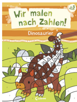
Wir malen nach Zahlen! - Dinosaurier