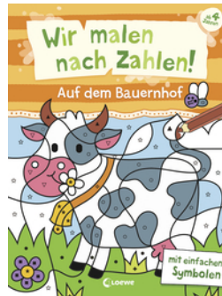
Wir malen nach Zahlen! - Auf dem Bauernhof