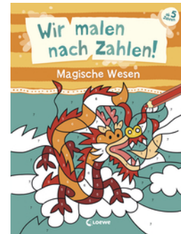
Wir malen nach Zahlen! - Magische Wesen