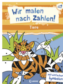
Wir malen nach Zahlen! - Tiere