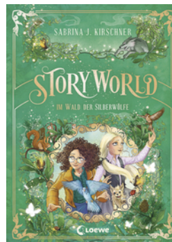
StoryWorld (Band 2) - Im Wald der Silberwölfe