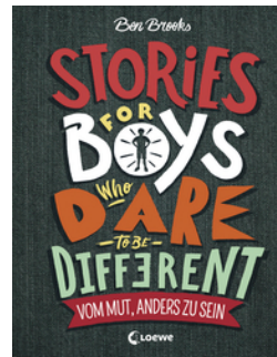
Stories for Boys Who Dare to be Different - Vom Mut, anders zu sein