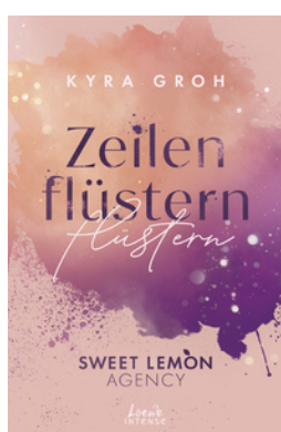
Zeilenflüstern (Sweet Lemon Agency, Band 1)