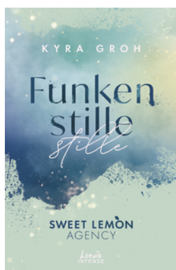
Funkenstille (Sweet Lemon Agency, Band 3)