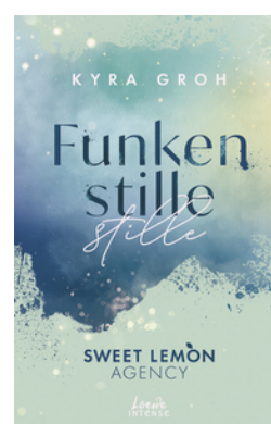
Funkenstille (Sweet Lemon Agency, Band 3)