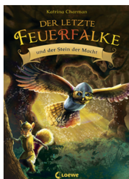
Der letzte Feuerfalke und der Stein der Macht (Band 1)