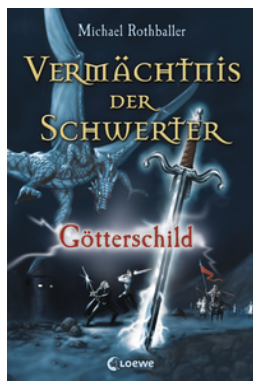
Vermächtnis der Schwerter (Band 3) – Götterschild