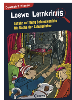
Loewe Lernkrimis - Gefahr auf Burg Schreckenfels / Die Rache der Schulgeister