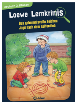
Loewe Lernkrimis - Das geheimnisvolle Zeichen / Jagd nach dem Reifendieb