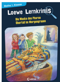
Loewe Lernkrimis - Die Maske des Pharaos / Überfall im Morgengrauen