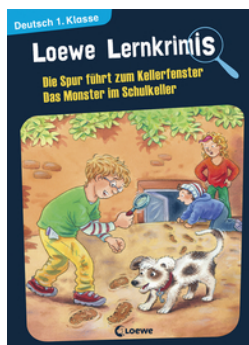
Loewe Lernkrimis - Die Spur führt zum Kellerfenster / Das Monster im Schulkeller