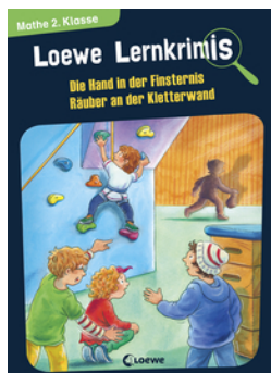
Loewe Lernkrimis - Die Hand in der Finsternis / Räuber an der Kletterwand