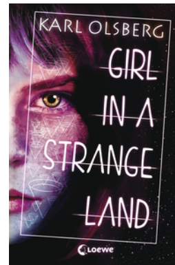
Girl in a Strange Land

... und 15 weitere Titel des Autors vorhanden.