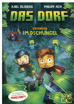
Das Dorf (Band 3) - Gefangen im Dschungel