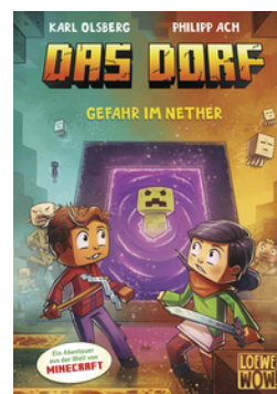
Das Dorf (Band 2) - Gefahr im Nether