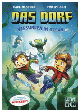
Das Dorf (Band 5) - Versunken im Ozean