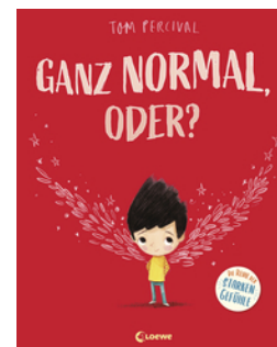
Ganz normal, oder? (Die Reihe der starken Gefühle)