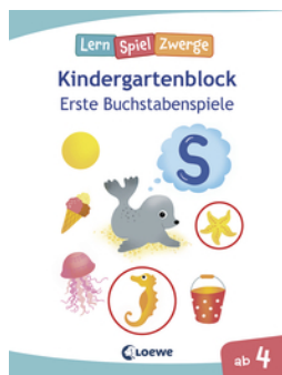
Die neuen LernSpielZwerge - Erste Buchstabenspiele