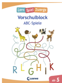
Die neuen LernSpielZwerge - ABC-Spiele