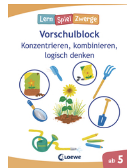
Die neuen LernSpielZwerge - Konzentrieren, kombinieren, logisch denken