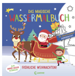
Das magische Wassermalbuch - Fröhliche Weihnachten!