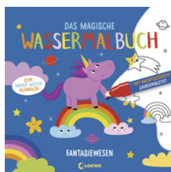
Das magische Wassermalbuch - Fantasiewesen