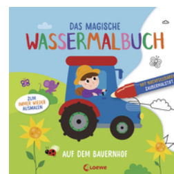
Das magische Wassermalbuch - Auf dem Bauernhof