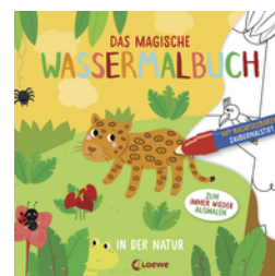
Das magische Wassermalbuch - In der Natur