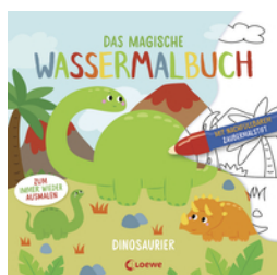
Das magische Wassermalbuch - Dinosaurier