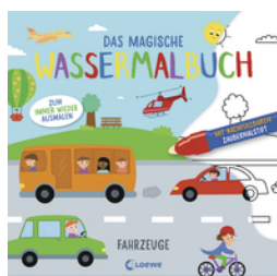
Das magische Wassermalbuch - Fahrzeuge