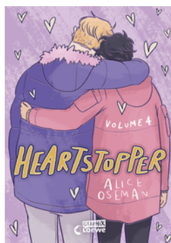
Heartstopper Volume 4 (deutsche Hardcover-Ausgabe)