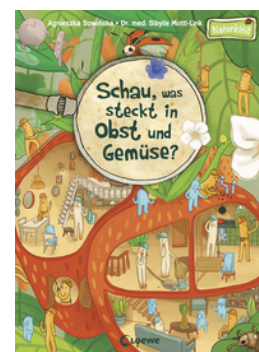
Schau, was steckt in Obst und Gemüse?