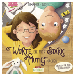
Worte, die mich stark und mutig machen