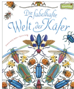
Die fabelhafte Welt der Käfer