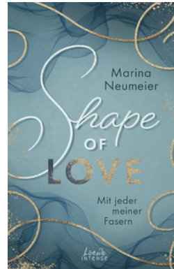
Shape of Love - Mit jeder meiner Fasern (Love-Trilogie, Band 1)