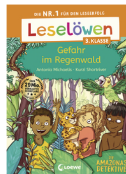
Leselöwen 3. Klasse - Amazonas-Detektive: Gefahr im Regenwald