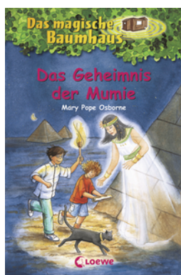
Das magische Baumhaus (Band 3) - Das Geheimnis der Mumie