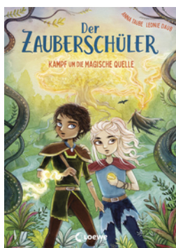
Der Zauberschüler (Band 4) - Kampf um die Magische Quelle