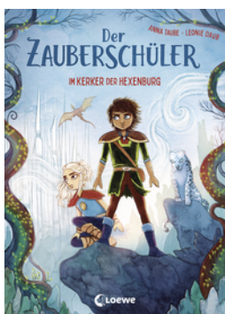
Der Zauberschüler (Band 5) - Im Kerker der Hexenburg