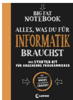
Big Fat Notebook - Alles, was du für Informatik brauchst - Das Starterkit für angenehme Programmierer