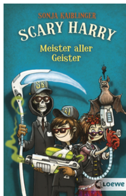
Scary Harry (Band 3) - Meister aller Geister