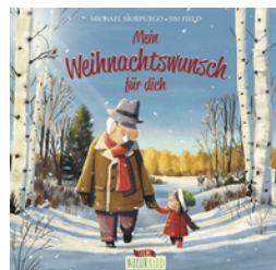
Mein Weihnachtswunsch für dich