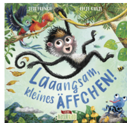
Laaangsam, kleines Äffchen!