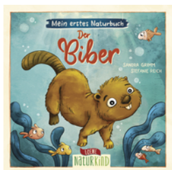
Mein erstes Naturbuch - Der Biber