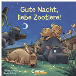
Gute Nacht, liebe Zootiere!