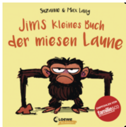
Jims kleines Buch der miesen Laune