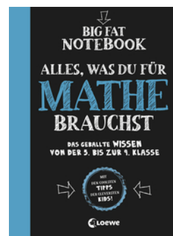
Big Fat Notebook - Alles, was du für Mathe brauchst - Das geballte Wissen von der 5. bis zur 9. Klasse