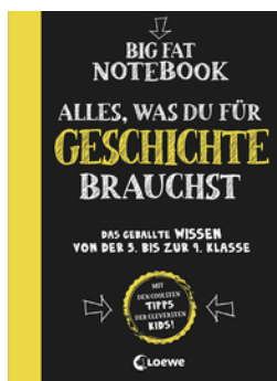
Big Fat Notebook - Alles, was du für Geschichte brauchst